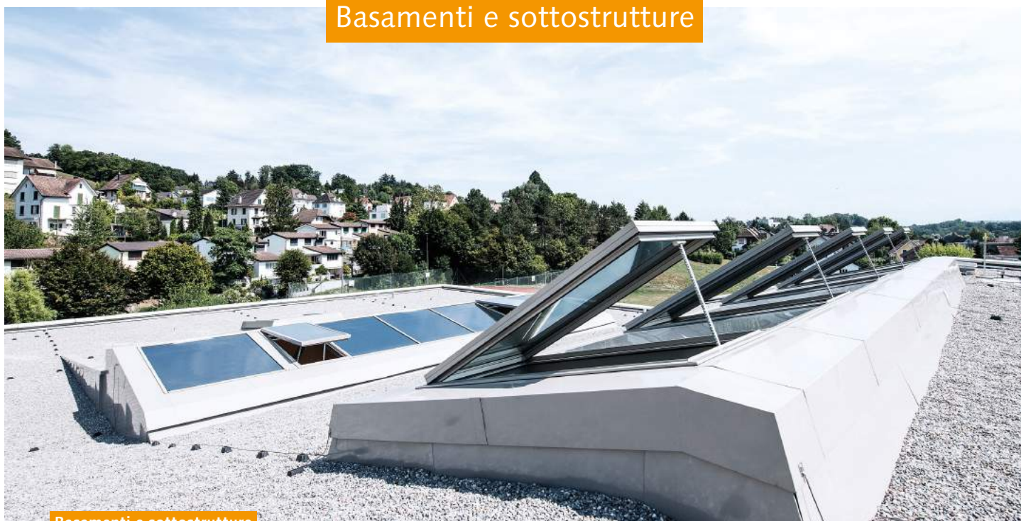
Basamenti e sottostrutture

La costruzione in vetro PR60 può essere modulata in base a tutte le sottostrutture elaborate in legno, cemento o metallo in base alle nostre specifiche. Su richiesta, forniamo e assembliamo basamenti in lamiera d'acciaio che vengono isolati e sigillati sul posto. Il PR60 può essere impiegato per creare qualsiasi forma di tetti classici, quali ad esempio tetti a spiovente, tetti a due falde, alla greca, piramidali, a padiglione, tetto ad arco e tutti i tetti poligonali, nonché forme a piacere e modulate in base al concept architettonico. I profili e le coperture sono disponibili in alluminio naturale o termolaccato con colori RAL.