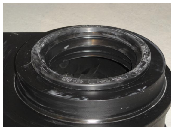
Schwimmersitz mit Dichtung (MAS und MAKs)