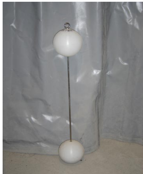
Selbsttätiger Abschluss (Schwimmer)