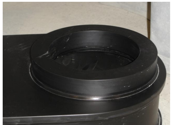
Filtersitz ohne Dichtung bei MAK