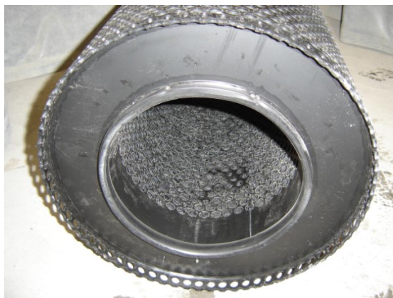
untere Dichtung vom Koaleszenzfilter