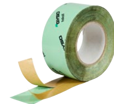
Folicoll P Breite 60 mm Art. Nr. 4331.7500.48