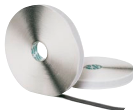
Strip 144 15 x 1,5 mm Art. Nr. 4920.4321.21