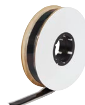
TwinStrip 40 x 3,0 mm Art. Nr. 5005.4000.30