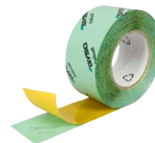
Folicoll Breite 50 mm / 60 mm Art. Nr. 4330.xxxx.xx