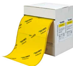
Folibond PADS 160 x 160 mm Art. Nr. 4332.7975.05