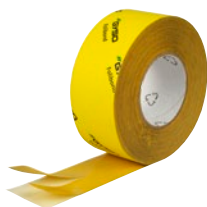
Folibond P Breite 60 mm | 30/30 mm / 12/48 mm Art. Nr. 4324.75xx.xx