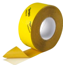
Folibond Breite 60 mm Art. Nr. 4323.7500.62