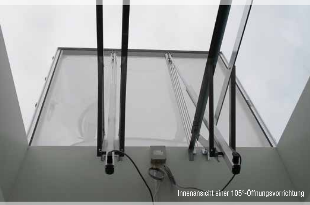
Innenansicht einer 105°-Öffnungsvorrichtung