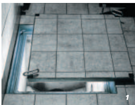
1 Tipo BV montato su una cavità per la pulizia