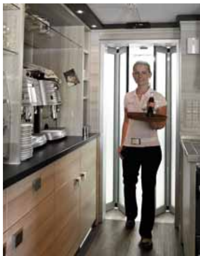
Porte automatique à vantaux pliants Gilgen FFM pour un maximum d'ouverture pour des espaces restreints.

Une vaste gamme d'éléments de commande et de sécurité vous permet de choisir la solution optimale pour vos besoins.