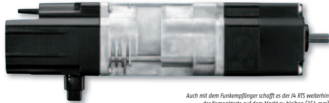
Auch mit dem Funkempfänger schafft es der J4 RTS weiterhin, der Kompakteste auf dem Markt zu bleiben (254 mm).